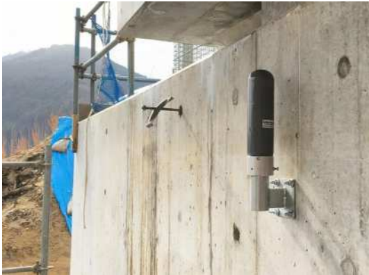
【災害箇所の変動計測】