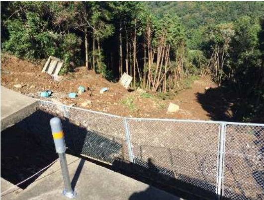
【災害箇所の変動計測】