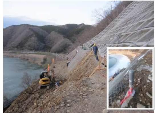
【のり面崩壊補修工事の安全管理】